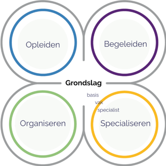
Figuur 4: vier bekwaamheidsdomeinen

Hieronder geven we per bekwaamheids-domein aan wanneer er sprake is van het basis-, en vakbekwaam en specialistniveau.