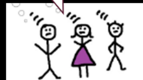
Het BRLO-team Windesheim

Met welke verdiepingactiviteiten gaan we voor de verschillende doelgroepen ons programma ontwerpen?