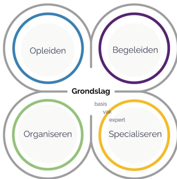
Figuur 4: vier bekwaamheidsdomeinen

In hoofdstuk 3 lees je meer over de kaders van waaruit je tot die selectie komt. Zoals je in figuur 3 ziet, kennen we in de beroepsstandaard vier bekwaamheidsdomeinen: Opleiden, Begeleiden, Organiseren en Specialiseren. Hieronder geven we per bekwaamheidsdomein aan wanneer er sprake is van het basis-, vak- en expert-bekwaamheidsniveau.